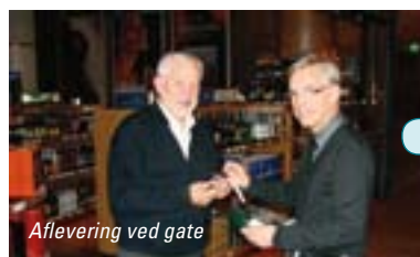
Aflevering ved gate