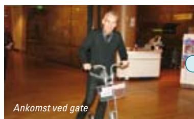
Ankomst ved gate