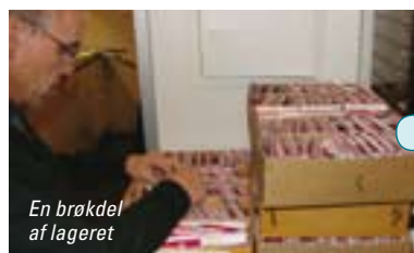
En brøkdæl af lageret